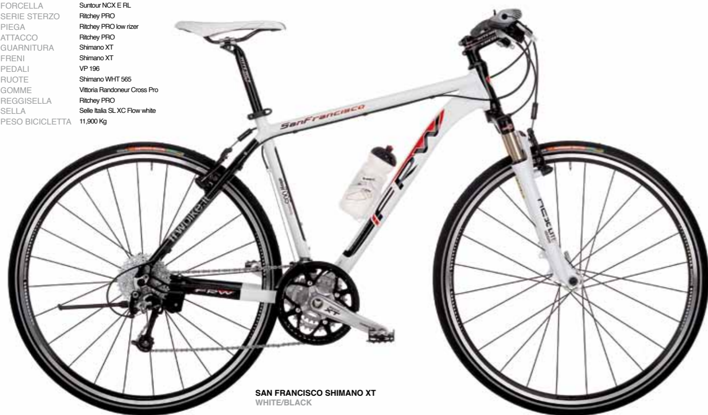
SAN FRANCISCO SHIMANO XT WHITE/BLACK