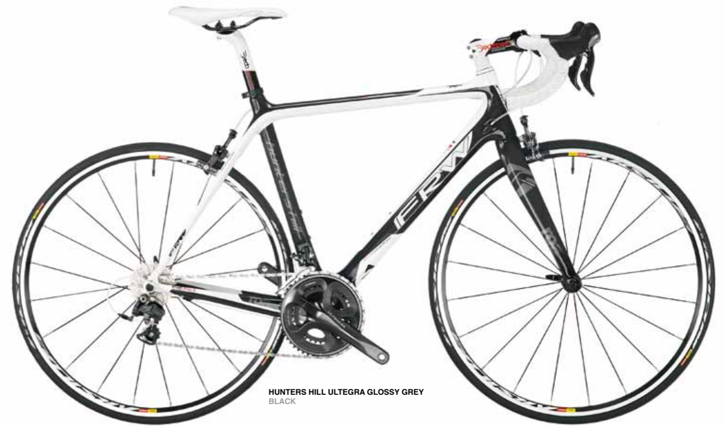
HUNTERS HILL ULTEGRA GLOSSY GREY BLACK

Il telaio in carbonio monoscocca K3 HM con la relativa forcella in carbonio K3 ha una linea tradizionale ma una costruzione che garantisce maggiore rigidità. Estremamente ampio il range degli allestimenti che completato con pedali Look Keo Classic, attacco manubrio e canotto sella Deda Elementi e ruote Mavic, permettono di soddisfare le esigenze di tutti, dall'amatore all'agonista.