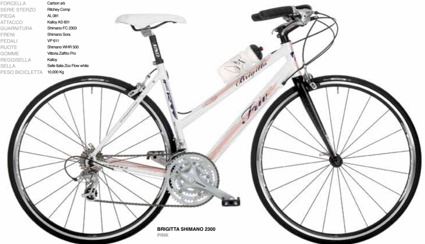
BRIGITTA SHIMANO 2300 PINK