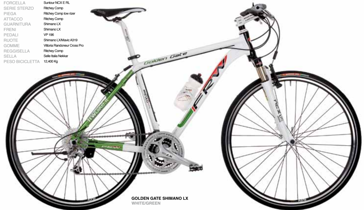
GOLDEN GATE SHIMANO LX WHITE/GREEN