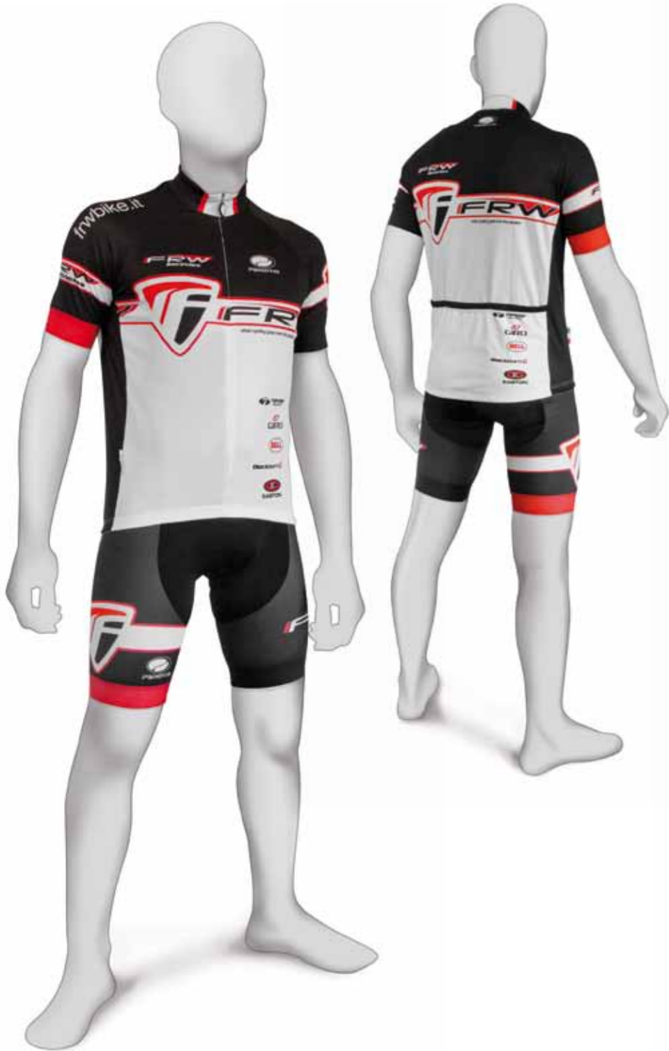
MAGLIA FRW MICRON MANICA CORTA