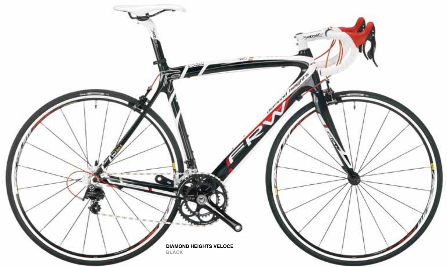
DIAMOND HEIGHTS VELOCE BLACK

Con un telaio realizzato con un mix di fibre Toray su base T700S e la relativa forcella carbonio UD, Diamond Heights è una bicicletta di altissimo livello tecnologico, con maggiore rigidità e leggerezza, diventando un nuovo punto di riferimento per tutti i cicloturisti senza alcun limite di peso.