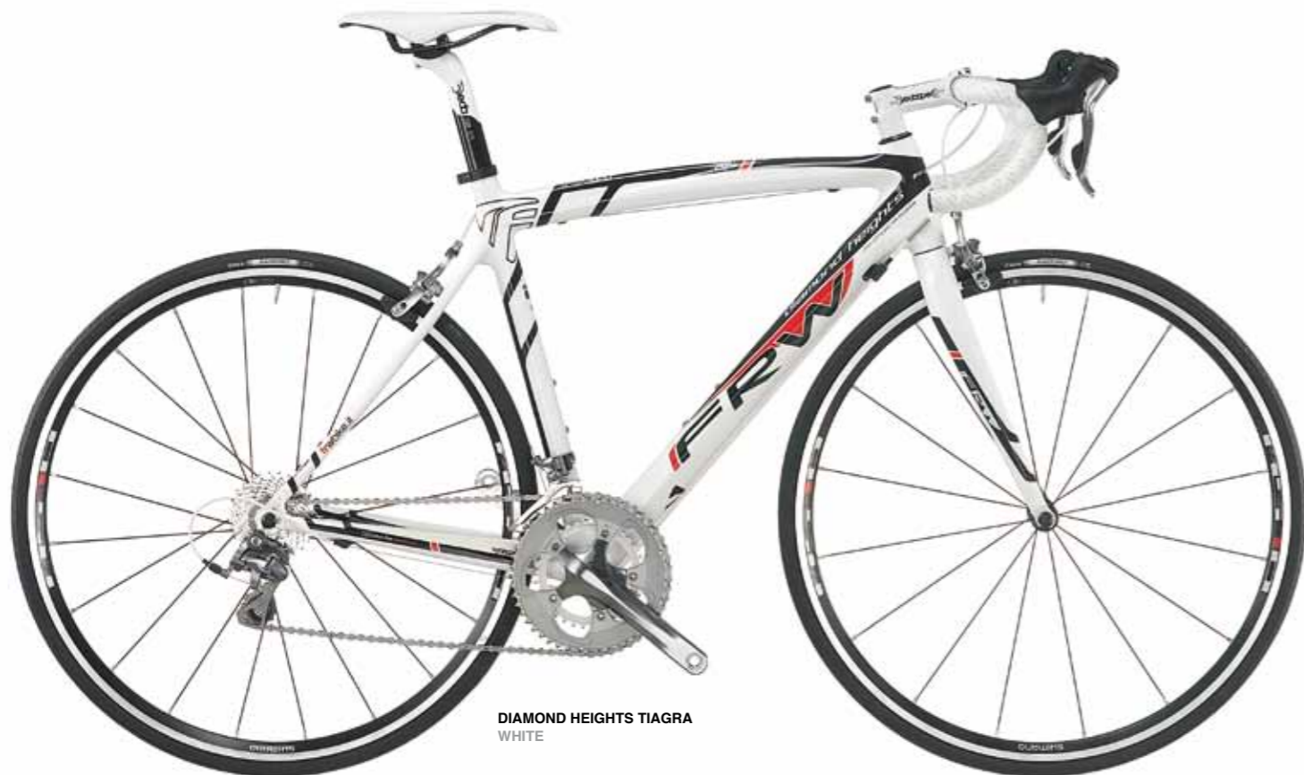
DIAMOND HEIGHTS TIAGRA WHITE