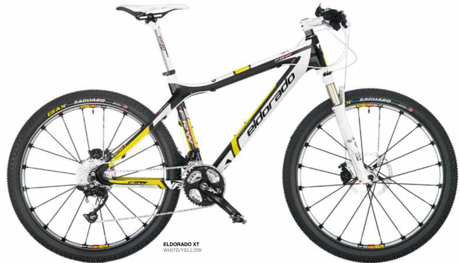
ELDORADO XT WHITE/YELLOW