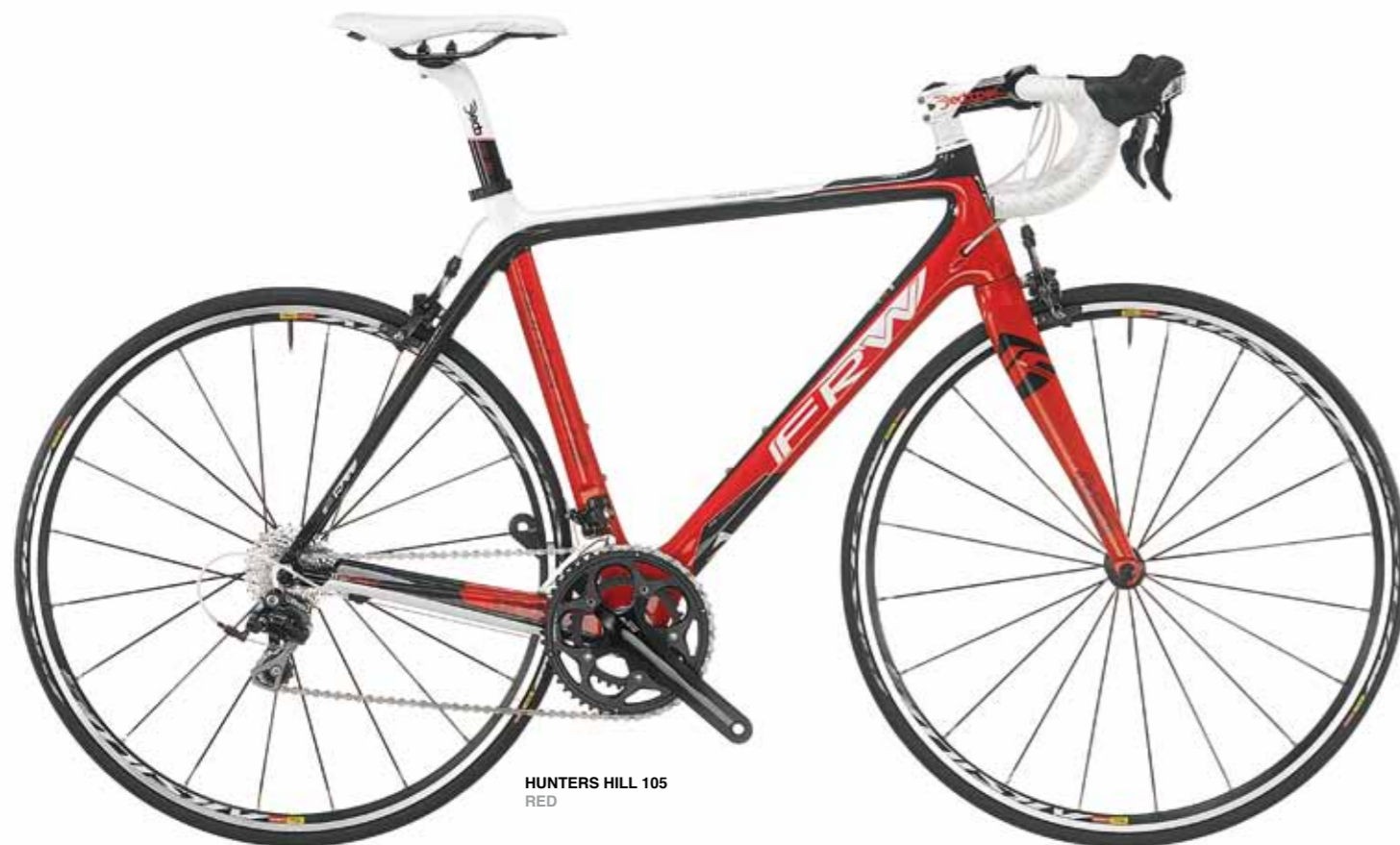
HUNTERS HILL 105 RED