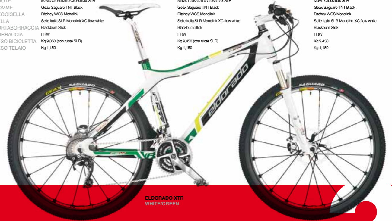
ELDORADO XTR WHITE/GREEN