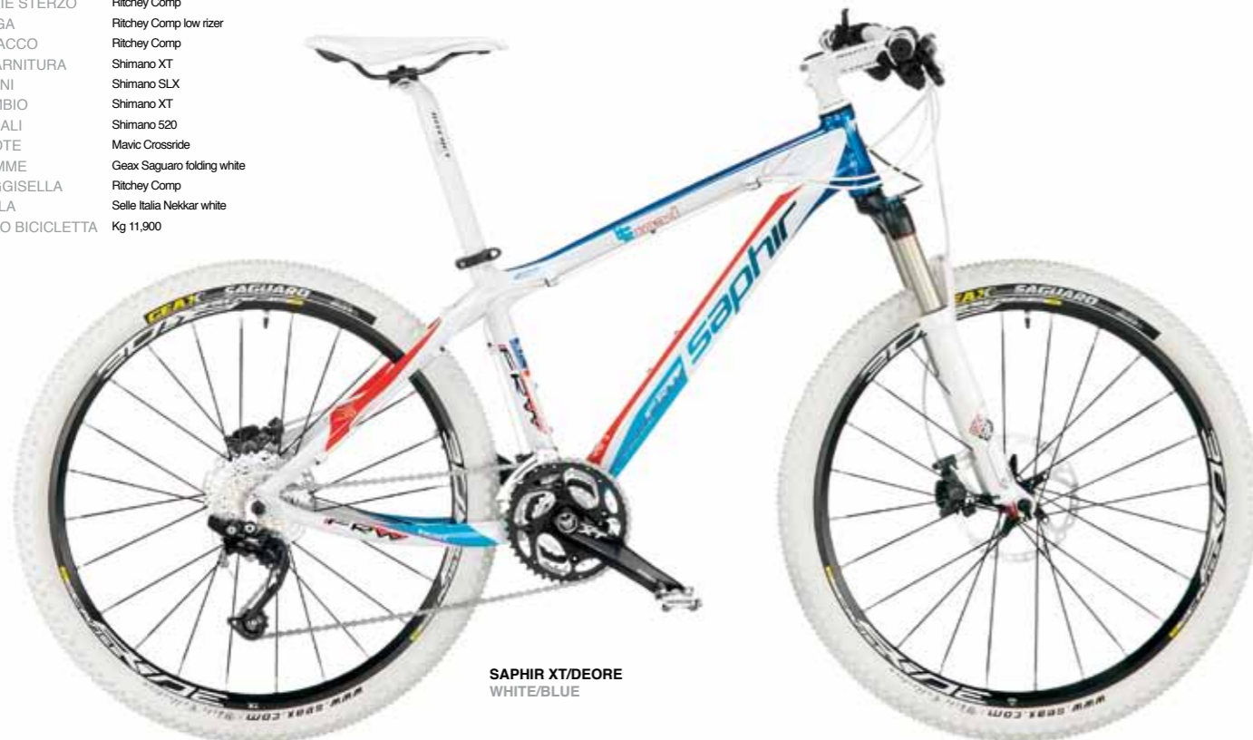
SAPHIR XT/DEORE WHITE/BLUE