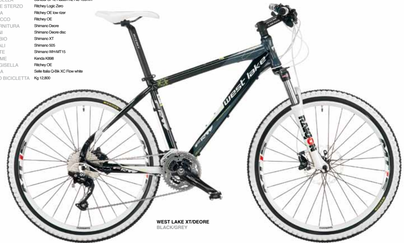
WEST LAKE XT/DEORE BLACK/GREY