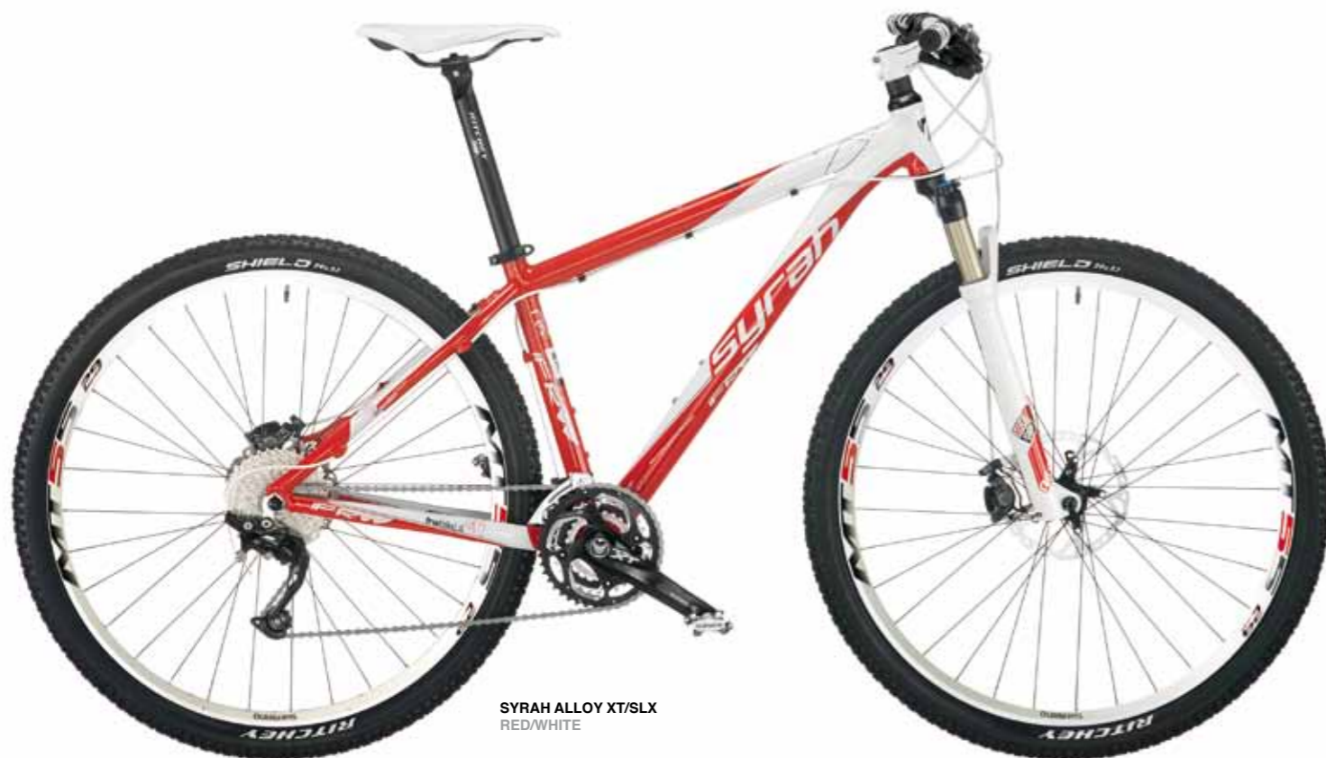
SYRAH ALLOY XT/SLX RED/WHITE