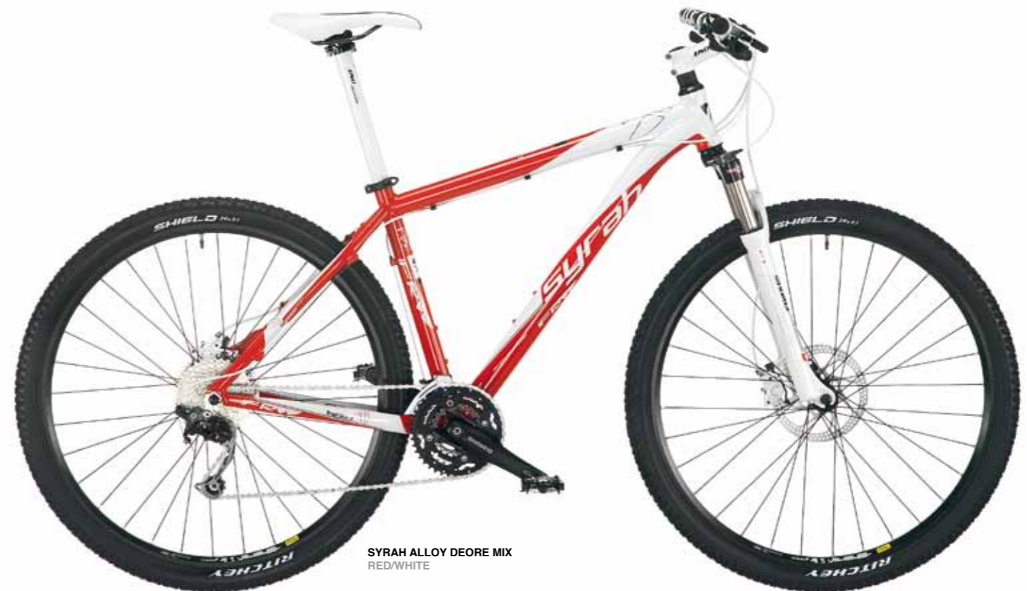
SYRAH ALLOY DEORE MIX RED/WHITE