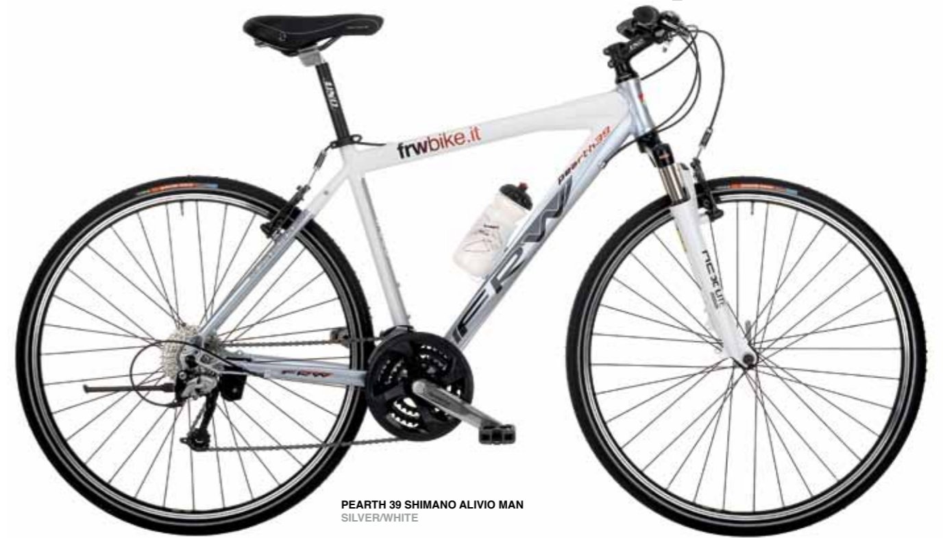
PEARTH 39 SHIMANO ALIVIO MAN SILVER/WHITE

Telaio in alluminio Hydroformato con forcellini posteriori in alluminio lavorati a CNC per sopportare la versione a disco e permettere l'adozione del cavalletto. Sia la versione da uomo che quella da donna montano il gruppo Deore 9x3 v-brake o disco.