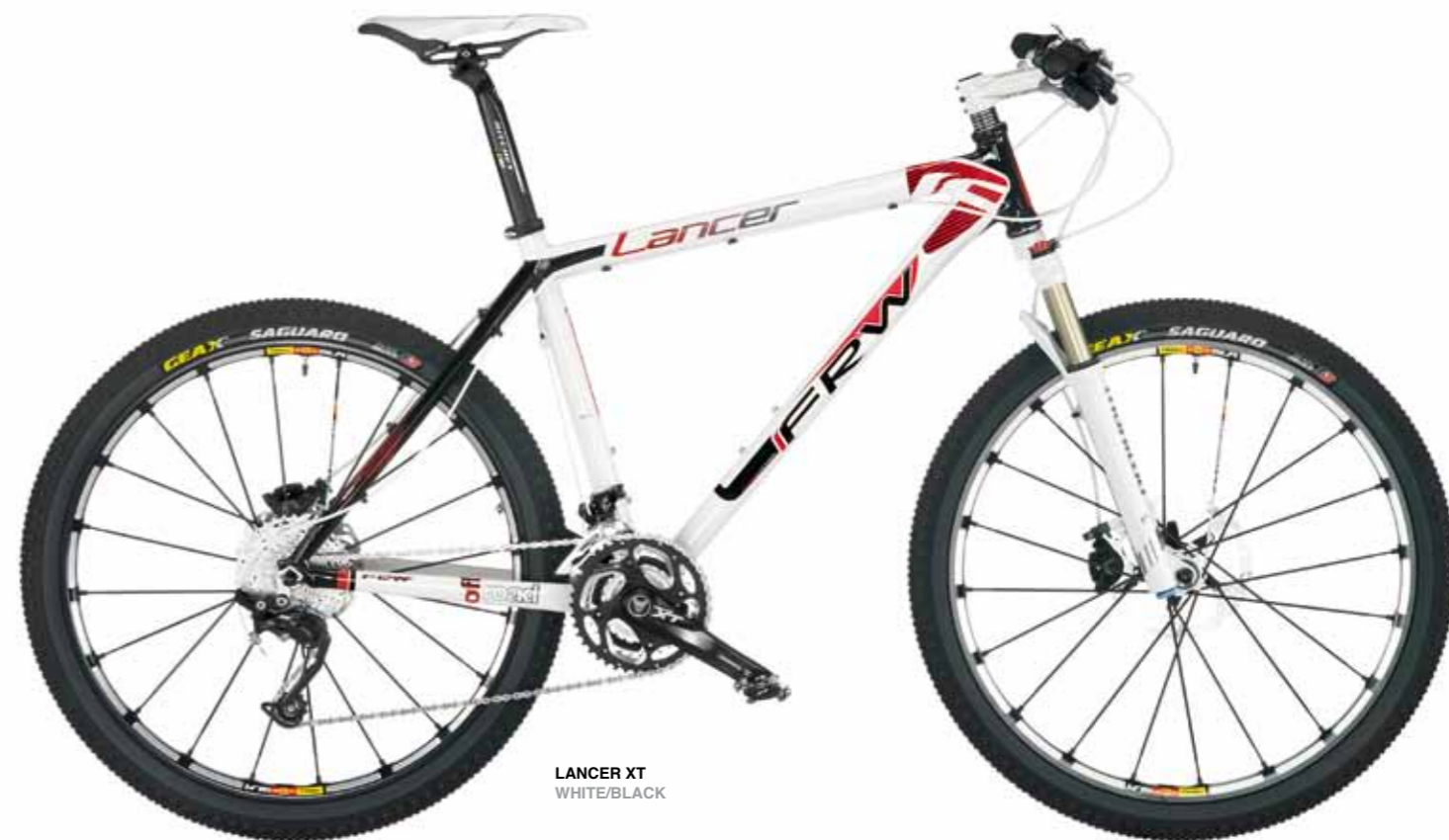
LANCER XT WHITE/BLACK

Lancer è un telaio in alluminio Scandio; per alluminio-scandio si intende una classe di leghe di alluminio ad alta resistenza superiore a qualsiasi altro composto intermetallico. La resistenza di queste leghe è tipicamente del 30-40% superiore all'Ergal, valore questo equiparabile alle leghe di titanio. Per questi motivi chi sceglie Lancer cerca un prodotto dalle caratteristiche tecniche e meccaniche adatte alle competizioni ad alto livello.