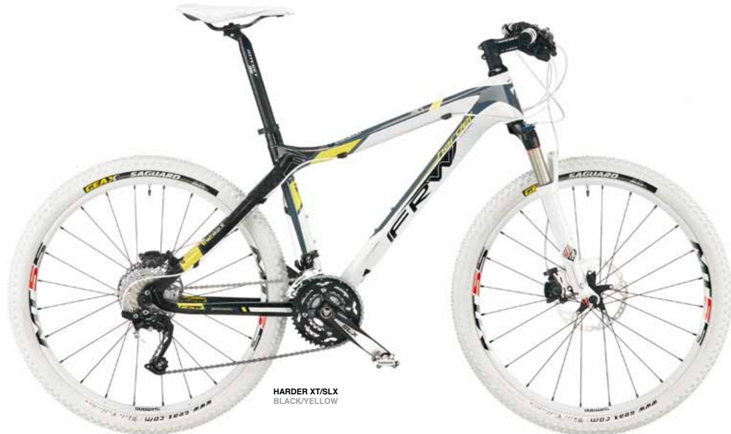
HARDER XT/SLX BLACK/YELLOW

Noi abbiamo avuto più fortuna concretizzando le nostre ricerche in questa MTB in carbonio monoscocca UD HM High Strength e Super High Modulus con finitura esterna in carbonio 12K incrociato a 45° dove i due stampi (uno per il triangolo anteriore e uno per il carro posteriore) si fondono in un'unica sagoma dall'aspetto accattivante e dalle altissime prestazioni che sono prerogativa delle nostre biciclette.