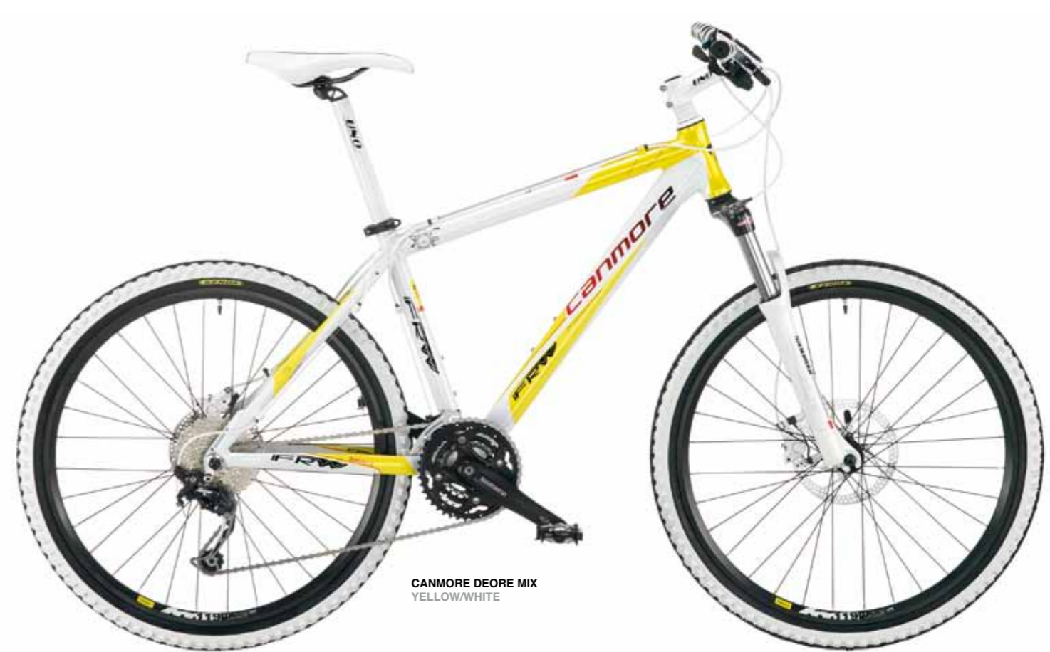
CANMORE DEORE MIX YELLOW/WHITE