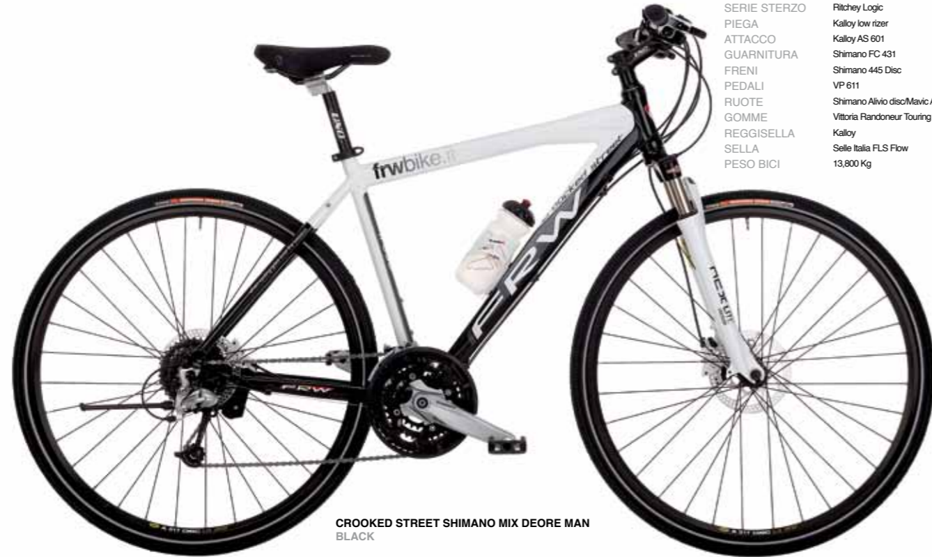
CROOKED STREET SHIMANO MIX DEORE MAN BLACK

CROOKED STREET SHIMANO MIX DEORE 9x3 DISC MAN/LADY Alluminio 7005 Hydroforming Suntour NCX D RL Ritchey Logic Kalloy low rizer Kalloy AS 601 Shimano FC 431 Shimano 445 Disc VP 611 Shimano Alivio disc/Mavic A319 disc Vittoria Randonneur Touring Kalloy Selle Italia FLS Flow 13,800 Kg