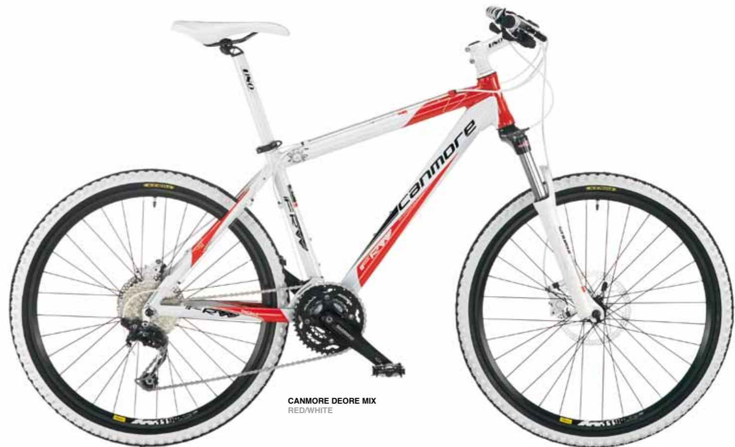
CANMORE DEORE MIX RED/WHITE