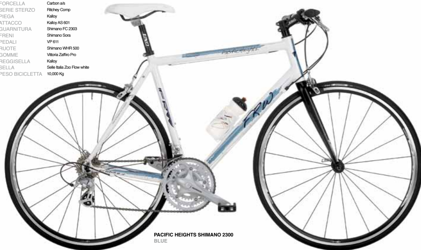
PACIFIC HEIGHTS SHIMANO 2300 BLUE