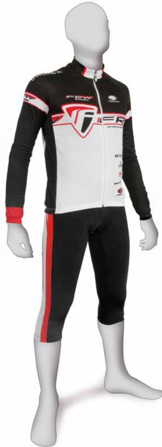
MAGLIA FRW TECNOGARZATO MANICA LUNGA