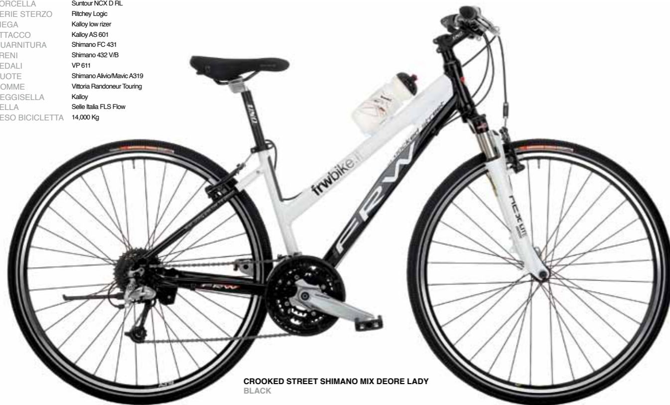
CROOKED STREET SHIMANO MIX DEORE LADY BLACK

TELAIO Alluminio 7005 Hydroforming FORCELLA Suntour NCX D RL SERIE STERZO Ritchey Logic PIEGA Kalloy low rizer ATTACCO Kalloy AS 601 GUARNITURA Shimano FC 431 FRENI Shimano 432 V/B PEDALI VP 611 RUOTE Shimano Alivio/Mavic A319 GOMME Vittoria Randonneur Touring REGGISSELLA Kalloy SELLA Selle Italia FLS Flow PESO BICICLETTA 14,000 Kg