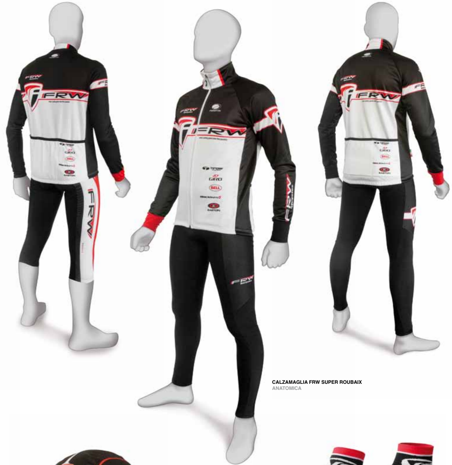
GIACCA FRW WINDTEX CON PILE