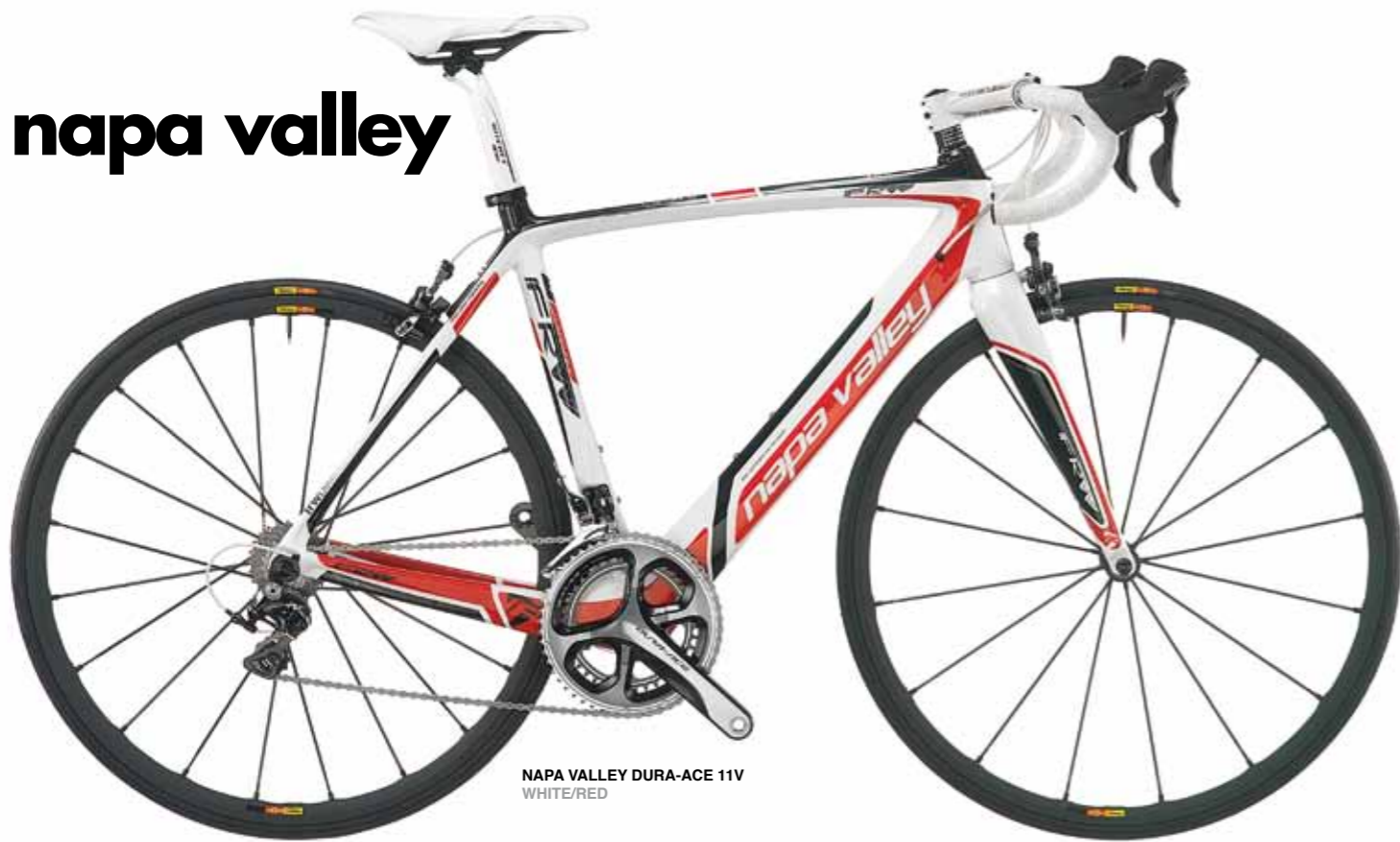
NAPA VALLEY DURA-ACE 11V WHITE/RED