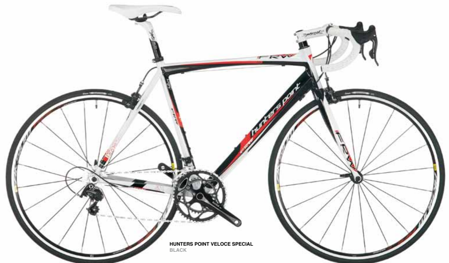
HUNTERS POINT VELOCE SPECIAL BLACK