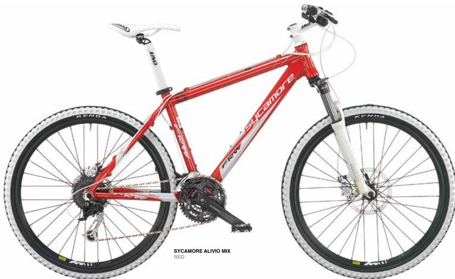
SYCAMORE ALIVIO MIX RED