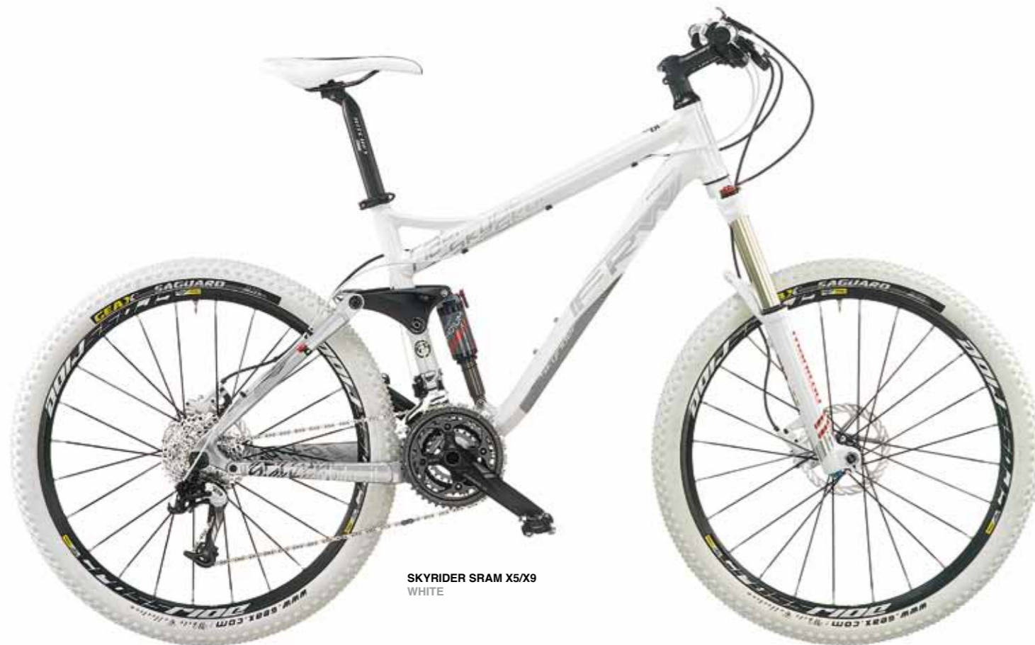
SKYRIDER SRAM X5/X9 WHITE

Un modello collaudato dalla stagione 2012 che, grazie ad un telaio all mountain/enduro con escursione di 140 mm realizzato in lega di alluminio 7005 a triplo spessore e al carro posteriore di tipo Dual Link che evita compressioni alla sospensione anteriore, rappresenta garanzia per far fronte anche alle uscite piu' impegnative. E' disponibile anche nella versione Race Kit telaio.