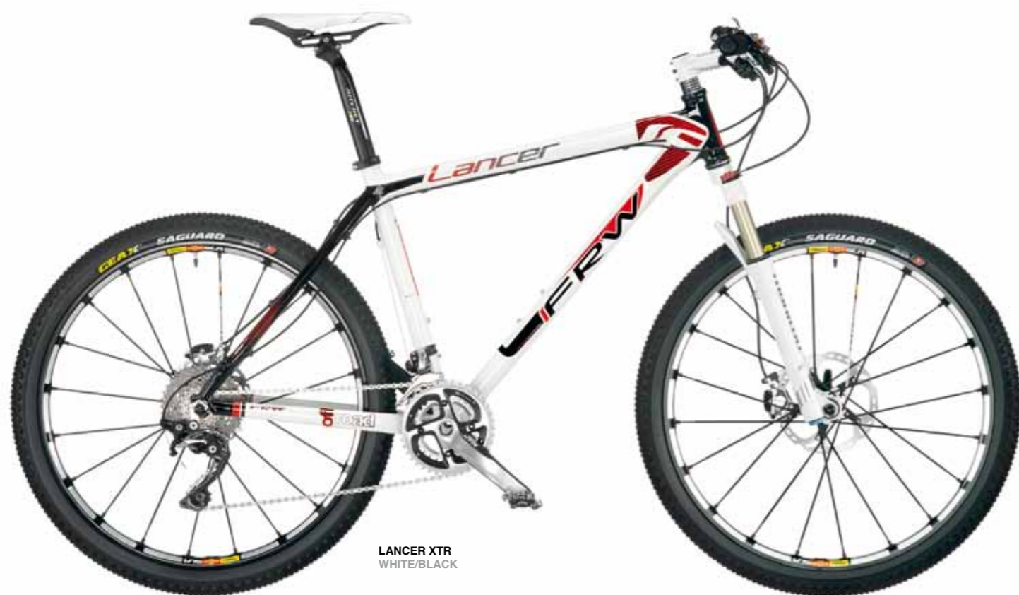
LANCER XTR WHITE/BLACK