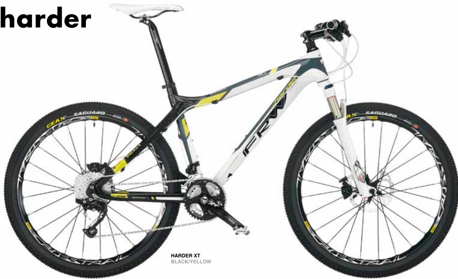
HARDER XT BLACK/YELLOW