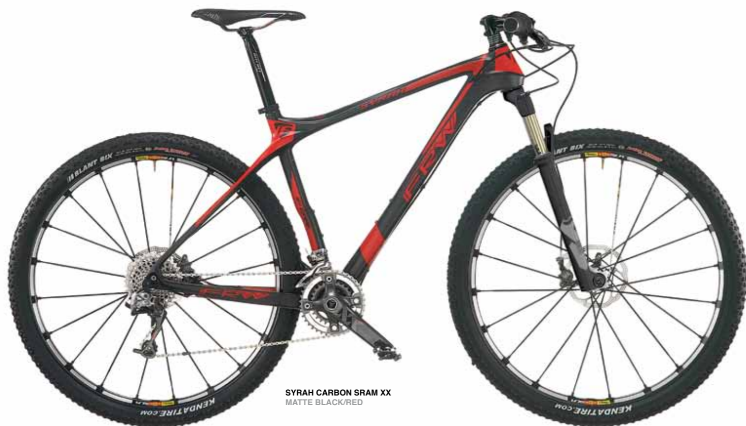
SYRAH CARBON SRAM XX MATTE BLACK/RED

29" Syrah Carbon 2013 telaio in carbonio monoscocca ad alte prestazioni 30Tons High Modulus con High Strenght IMS60 Carbon Pre-Preg, questa è la ricetta per ottenere un telaio altamente performante con valori STW (Stiffness To Weight) incrementati del 20% rispetto ad una MTB tradizionale. La tecnologia dei materiali compositi altamente performanti (grafite e resina epossidica) conferisce al telaio eccellente assorbimento degli impatti, facilità di guida e un'ottima risposta alle accelerazioni della bici.