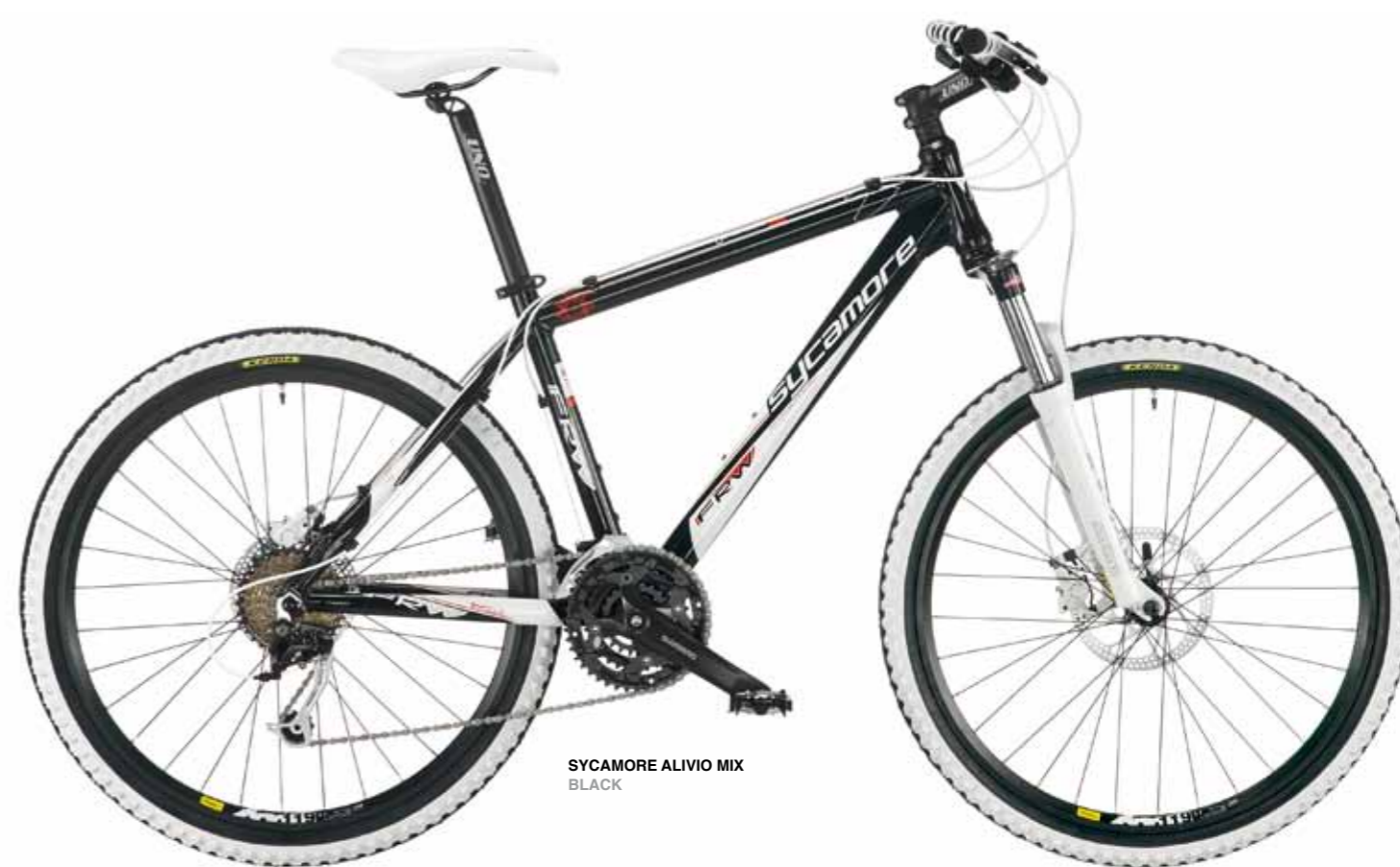
SYCAMORE ALIVIO MIX BLACK

Entry-level della famiglia FRW dal quale traspare tutto il DNA FRW. Una bicicletta estremamente affidabile ed assemblata con gruppo Shimano Alivio mix a 9 velocità e freno a disco Shimano idraulico. Con nuove opzioni colore e equipaggiate con nuove selle bicolori Q-Bik Team, Selle italia e nuove catene bicolori KMC abbinata al colore del telaio.