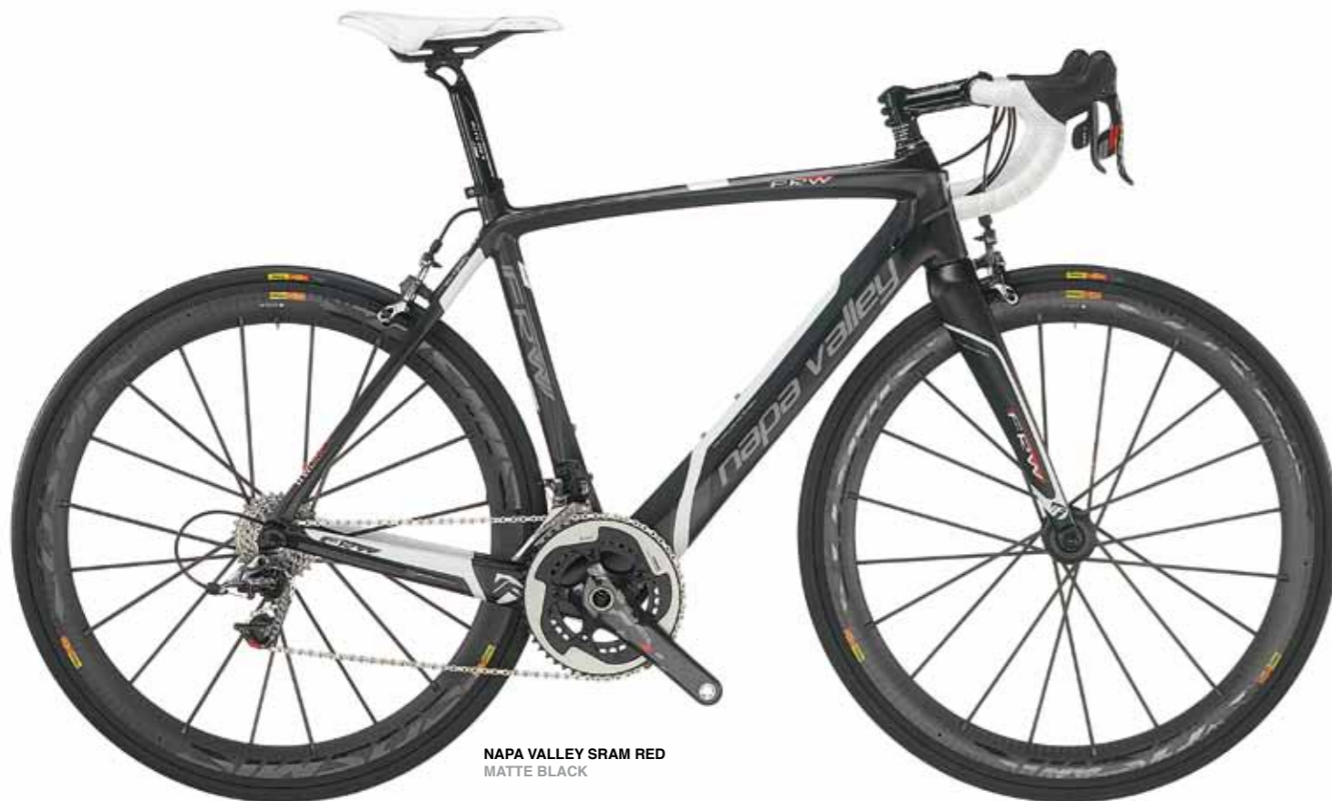
NAPA VALLEY SRAM RED MATTE BLACK