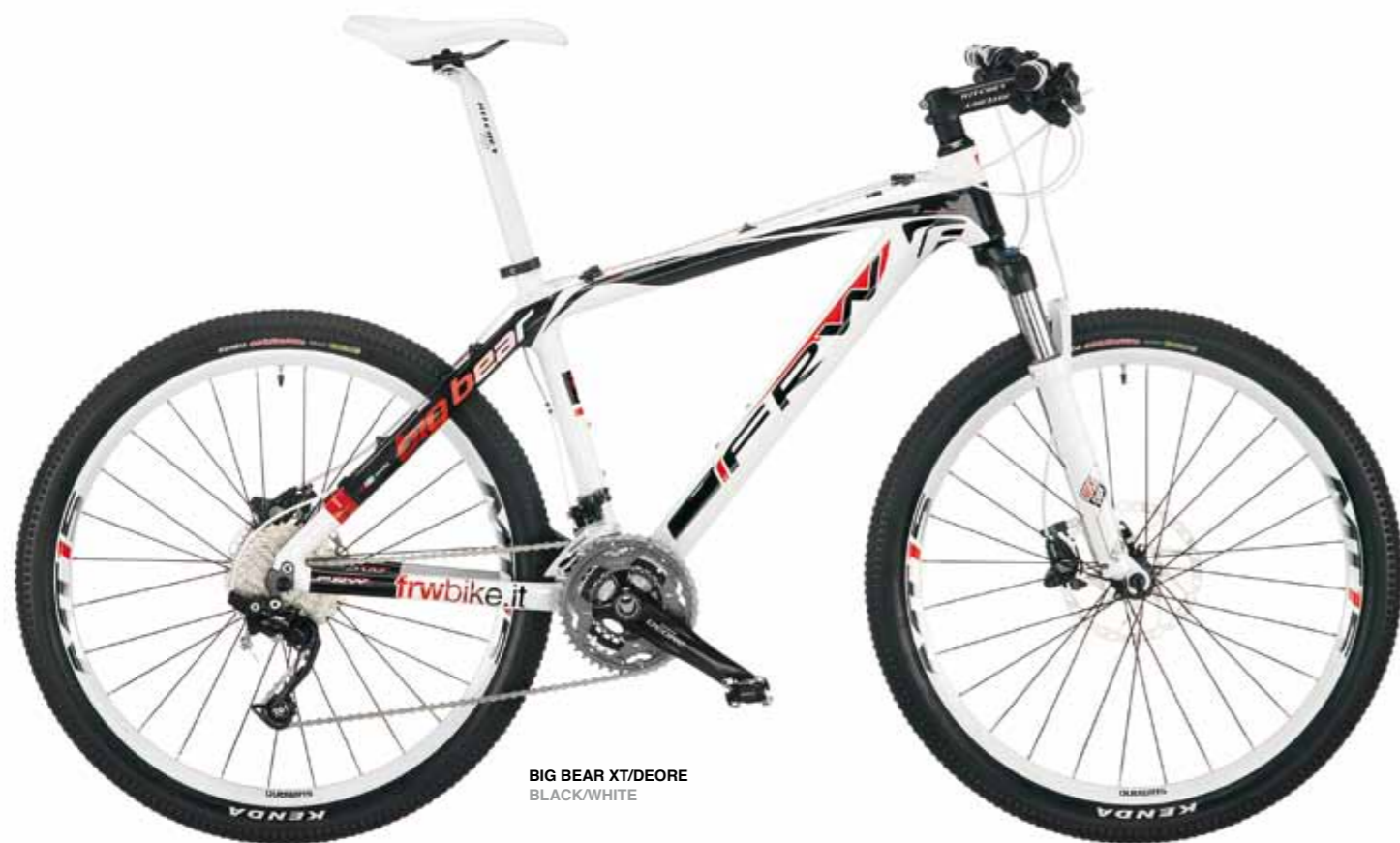
BIG BEAR XT/DEORE BLACK/WHITE