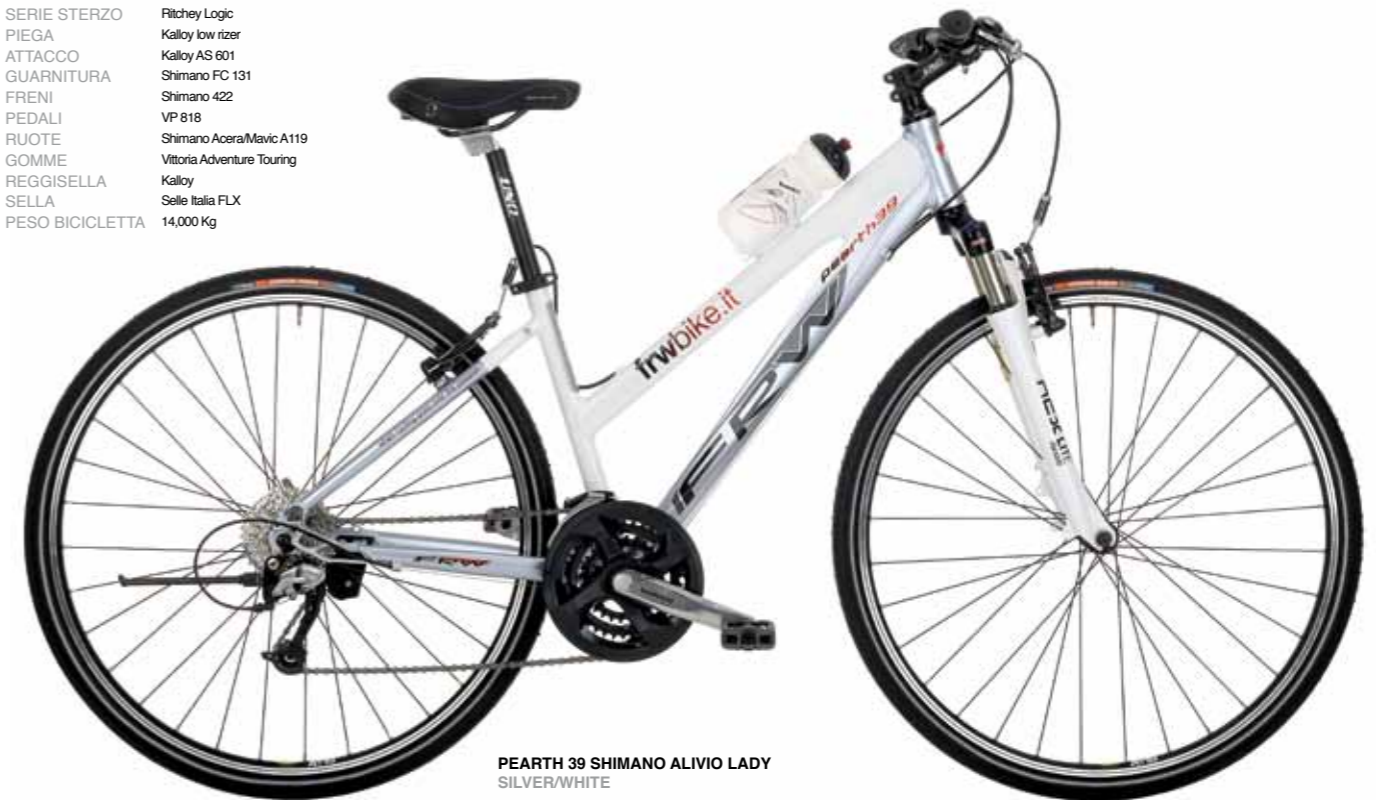
PEARTH 39 SHIMANO ALIVIO LADY SILVER/WHITE

TELAIO Alluminio 7005 Hydroforming FORCELLA Suntour NCX D MLO SERIE STERZO Ritchey Logic PIEGA Kalloy low rizer ATTACCO Kalloy AS 601 GUARNITURA Shimano FC 131 FRENI Shimano 422 PEDALI VP 818 RUOTE Shimano Acera/Mavic A119 GOMME Vittoria Adventure Touring REGGISSELLA Kalloy SELLA Selle Italia FLX PESO BICICLETTA 14,000 Kg