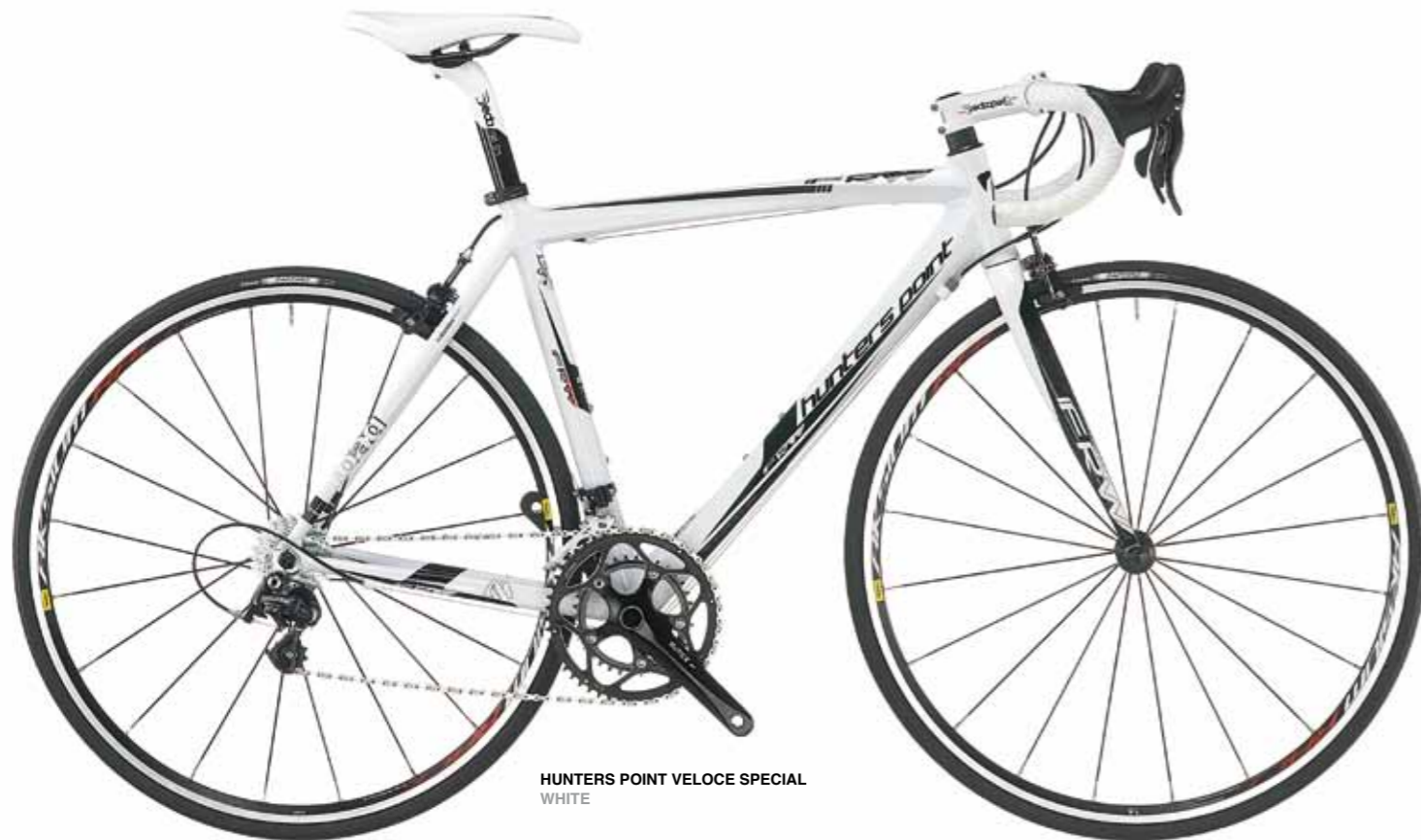
HUNTERS POINT VELOCE SPECIAL WHITE