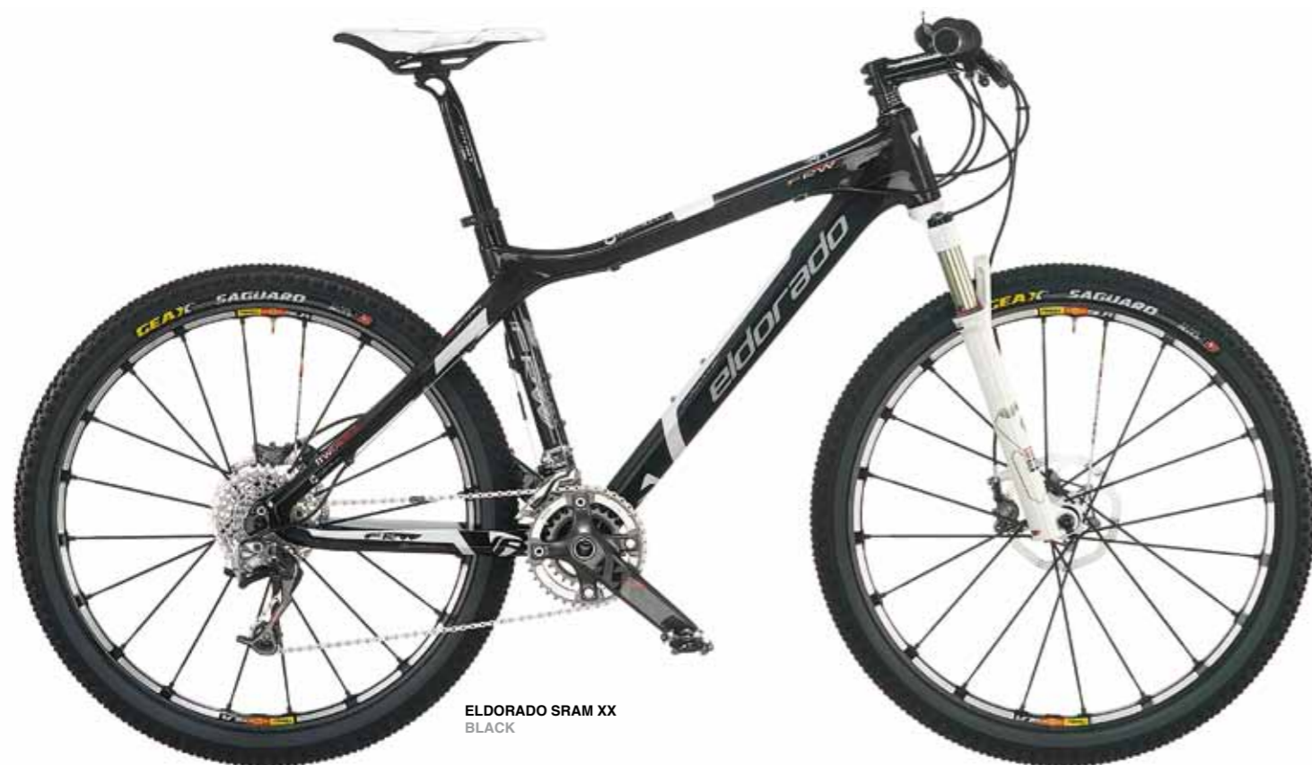
ELDORADO SRAM XX BLACK