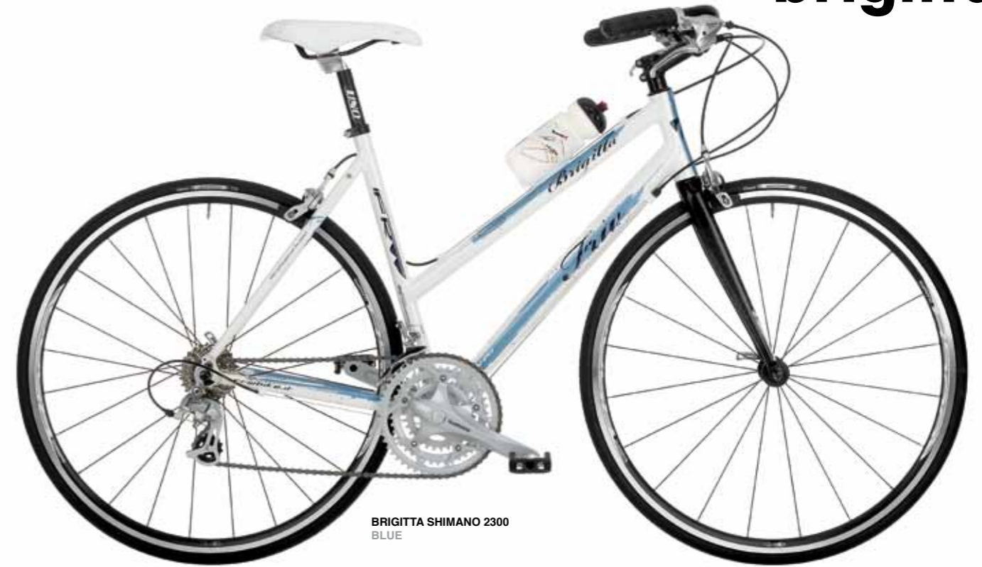
BRIGITTA SHIMANO 2300 BLUE

Versione lady del modello Pacific Heights.