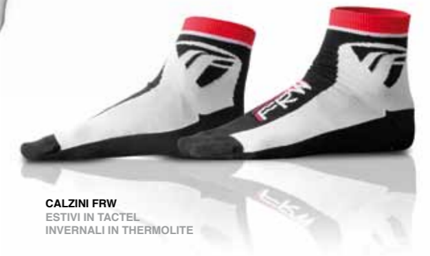
CALZINI FRW ESTIVI IN TACTEL INVERNALI IN THERMOLITE