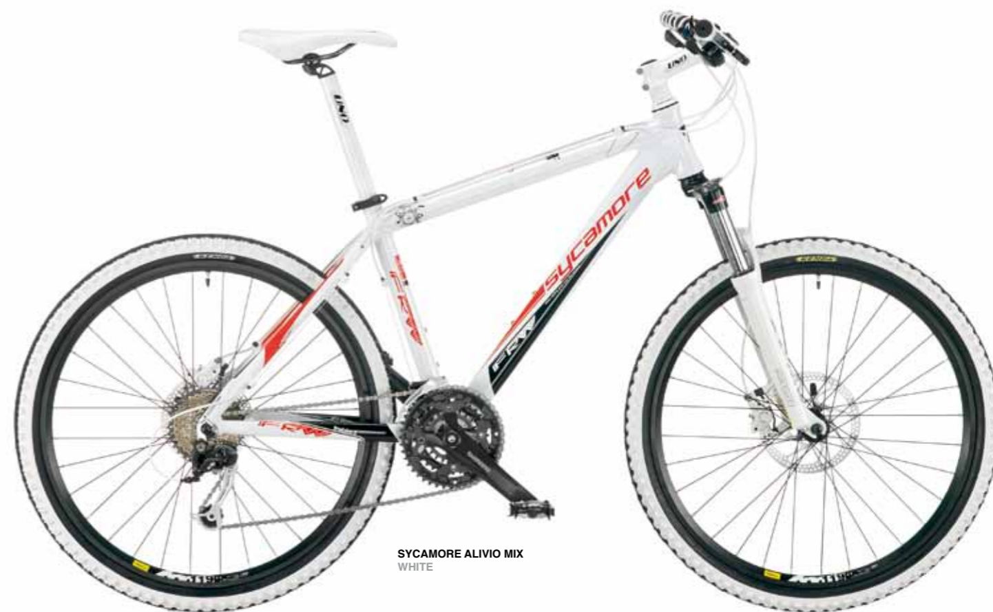
SYCAMORE ALIVIO MIX WHITE