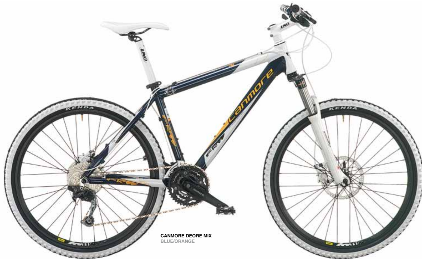
CANMORE DEORE MIX BLUE/ORANGE