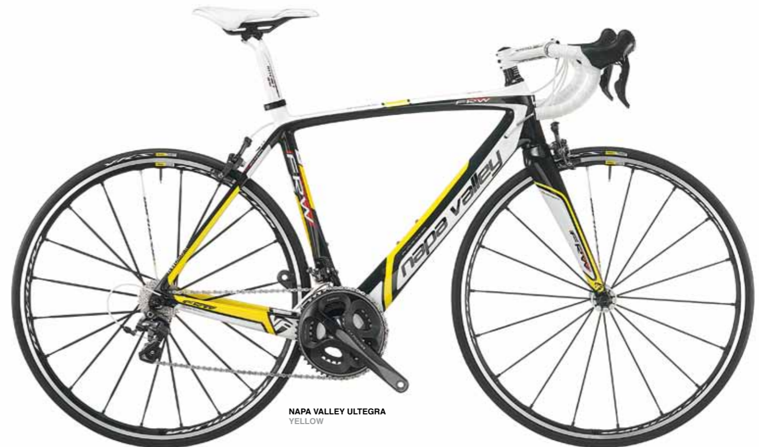
NAPA VALLEY ULTEGRA YELLOW