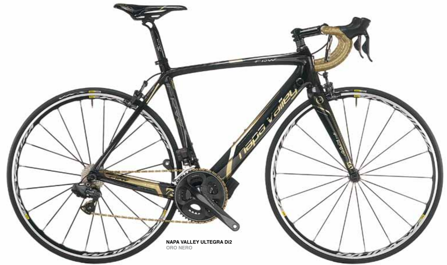
NAPA VALLEY ULTEGRA DI2 ORO NERO

Tutte le caratteristiche di Napa Valley in una esclusiva ed elegante colorazione in serie limitata creata per il progetto "TEAM ORONERO RVB FRW".