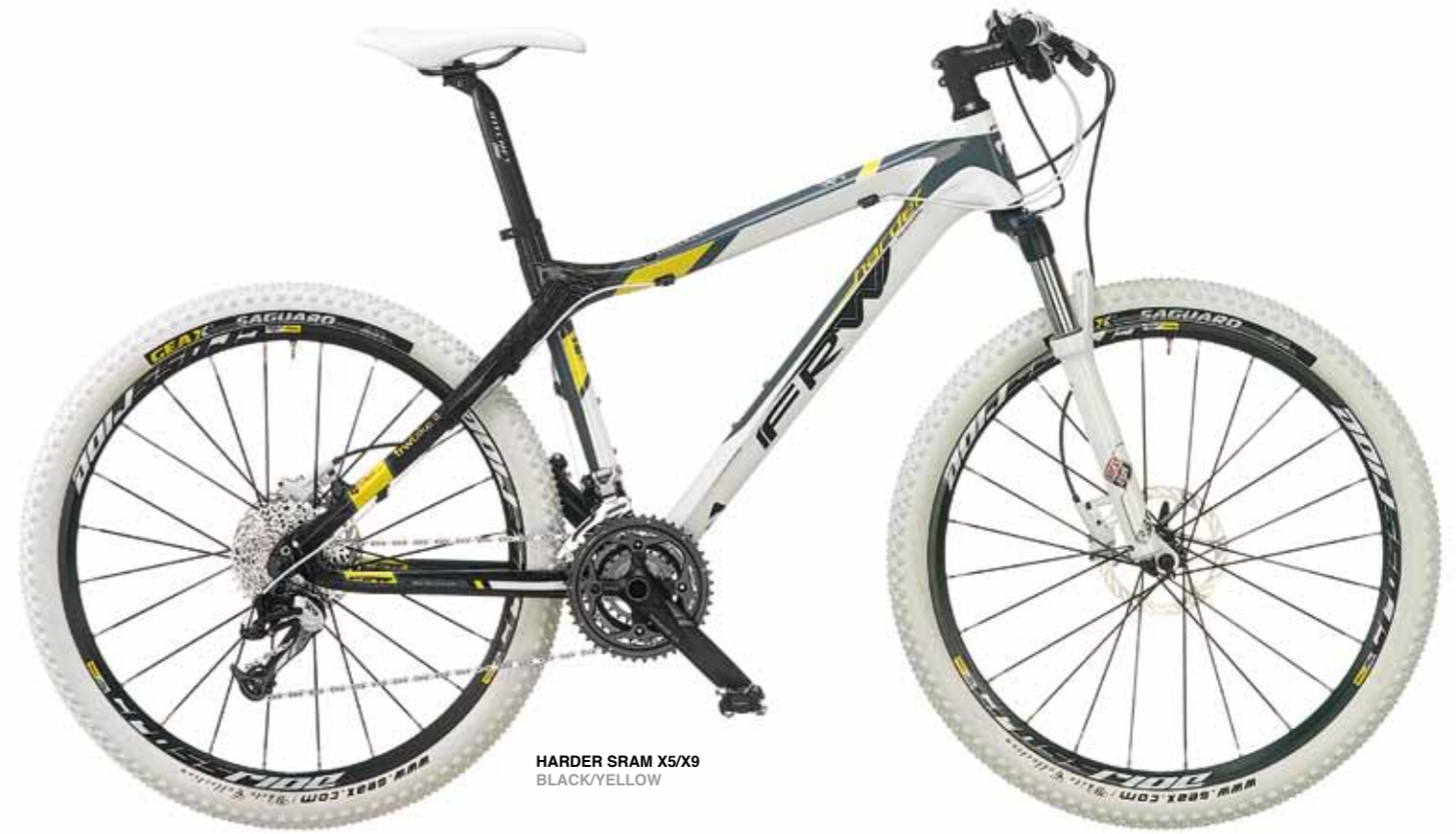
HARDER SRAM X5/X9 BLACK/YELLOW

Harder 2013 è il giusto mix tra estetica, tecnologia e tutto quello che chiediamo alla nostra bicicletta... ottime prestazioni.